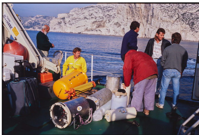
Equipe de la première campagne d'étude de la grotte Cosquer 1994 à bord de l'Archéonaute/DRASSM