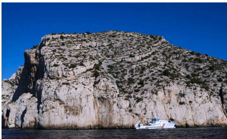
Navire André Malraux réalisant des levées bathymétriques au large des Calanques