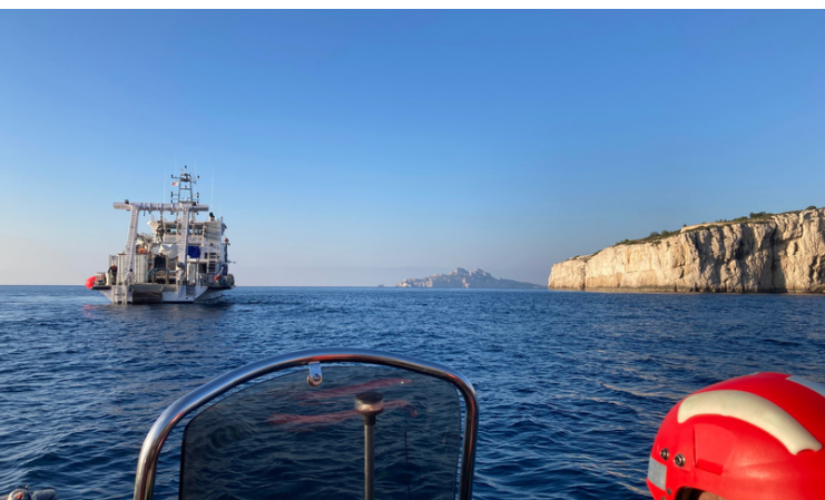
Navire André Malraux réalisant des levées bathymétriques au large des Calanques